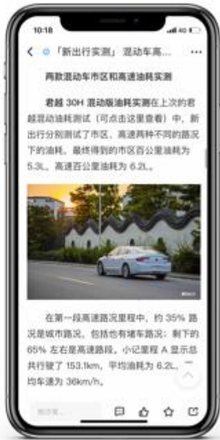
表述严谨 内容全面 格式清晰