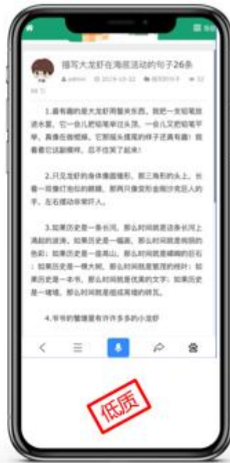
内容与标题不相关