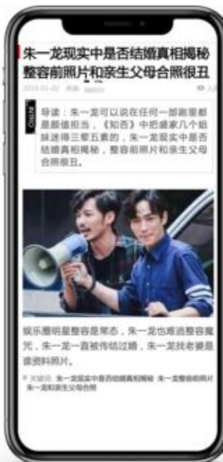
写作信息不清 内容与标题不符