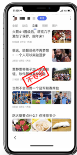
非权威站点 账号 发布健康医疗内容