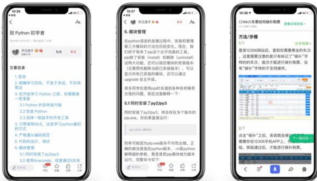
格式排版清晰 内容专业 实操性强