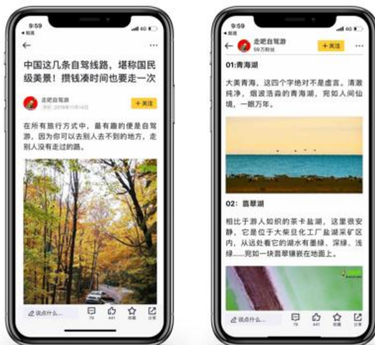
文笔优美 配图精心