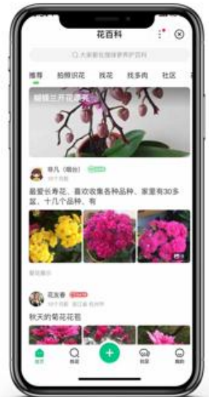
垂直平台 领域专一