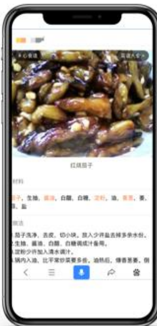
配图不清晰 缺少过程图片